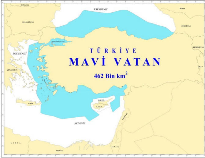
Mavi Vatan haritası 113