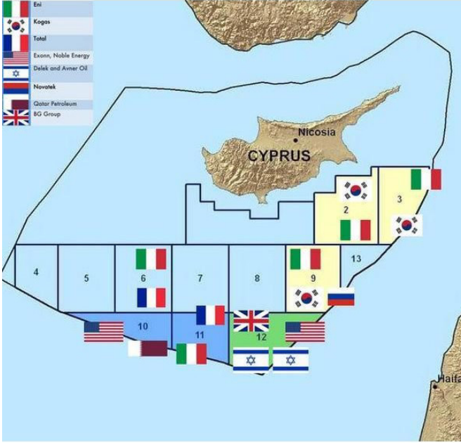
Doğu Akdeniz'deki enerji şirketleri ve faaliyet gösterdikleri parseller 84

Henüz taraflar arasında herhangi bir çatışma yaşanmamasına karşın, Doğu Akdeniz'deki anlaşmazlıklar son yıllarda Türk-Fransız ilişkilerinde ciddi bir sorun olarak karşımıza çıkmıştır. Hatta 2020 yılı Haziran ayı içerisinde, Doğu Akdeniz'de NATO misyonu “ Sea Guardian ” (Deniz Muhafızı) kapsamında seyir halinde bulunan Fransız “ Courbet ” gemisi, Türk fırkateynleri tarafından tacize uğradığını (füze atışı öncesi son uyarı anlamına gelen radar kitlemesi yapılarak) iddia etmiş; ancak NATO tarafından hazırlanan 130 sayfalık raporda böyle bir sonuca ulaşılmayınca, Fransa, bu NATO görevinden çekildiğini