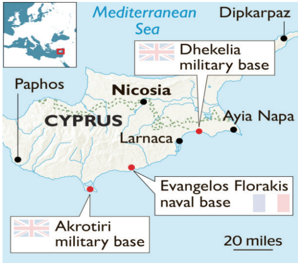
Kıbrıs'taki askeri üsler 75

Anlaşmada Fransız donanmasının Kıbrıs'ın güneyinde doğalgaz araştırmaları yapan TOTAL firmasına ait gemileri de korumayı taahhüt ettiği belirtilmektedir. 74 Kıbrıs adası, hiç şüphesiz, bölgede askeri varlığı olan ülkeler için Ortadoğu ve Kuzey Afrika gibi coğrafyalara yakınlığı bağlamında çok önemli bir jeostratejik merkez durumundadır. Nitekim Türkiye, Kıbrıs'ın kuzeyinde Kıbrıslı Türklerin haklarını korumanın yanında, adadaki askeri varlığını anakaranın savunulması ve Doğu Akdeniz'de güçlü olunması bağlamında stratejik bir hedef olarak değerlendirmektedir. Buna karşın, Türkiye'nin 2004 yılında yapılan Annan Planı'na destek verdiği ve Kıbrıs'ta çözüme ilkesel olarak karşı çıkmadığı da hatırlanmalıdır.